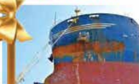
Al final la embarcación al astillero

E l astillero llevó a cabo uno de los proyectos navales más especiales del año, en el último bimestre del 2017. Se reconstruyó la proa de un buque granelero que navegó desde Sudamérica hasta TNG para llevar a cabo el reemplazo de 75 toneladas de acero. Dentro de la reparación se chatarrearon los elementos dañados y se fabricaron las nuevas cubiertas y elementos estructurales internos, culminando con el montaje del forro del casco y el recubrimiento anticorrosivo del mismo.