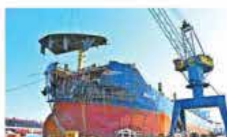
Los bloques fabricados fueron montados