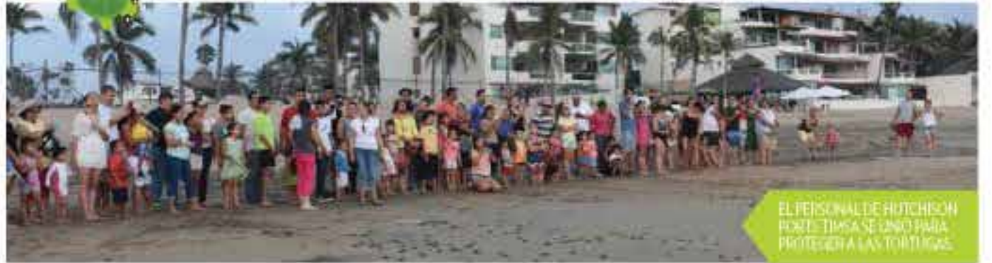
EL PERSONAL DE HUTCHISON PORTS TIMSA SE UNIO PARA PROTEGER A LAS TORTUGAS.

Con el fin de contribuir con el cuidado de la fauna de la región, el personal de TIMSA junto con sus familiares, realizó la liberación de 144 tortugas el 18 y 25 de noviembre. Los participantes revisaron los nidos en la playa de la comunidad de Salagua, Manzanillo, Colima. Al finalizar la liberación, los hijos de los trabajadores presentaron algunos dibujos que hicieron y contaron la historia de su animal marino.