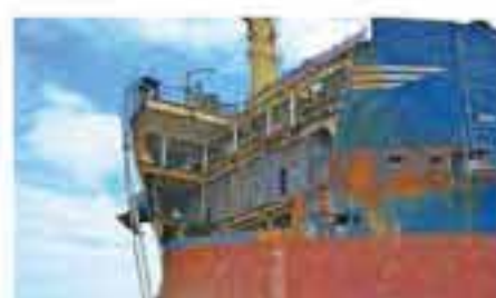
Se corta y extrae el acero dañado