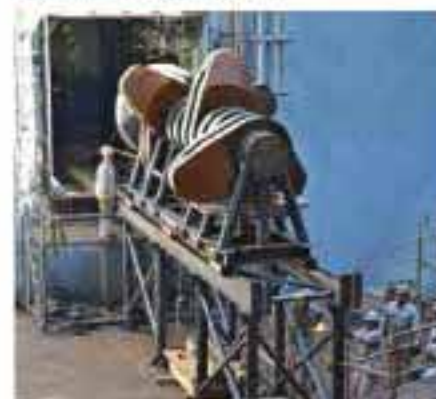
Se desliza el cigüeñal en sus rieles