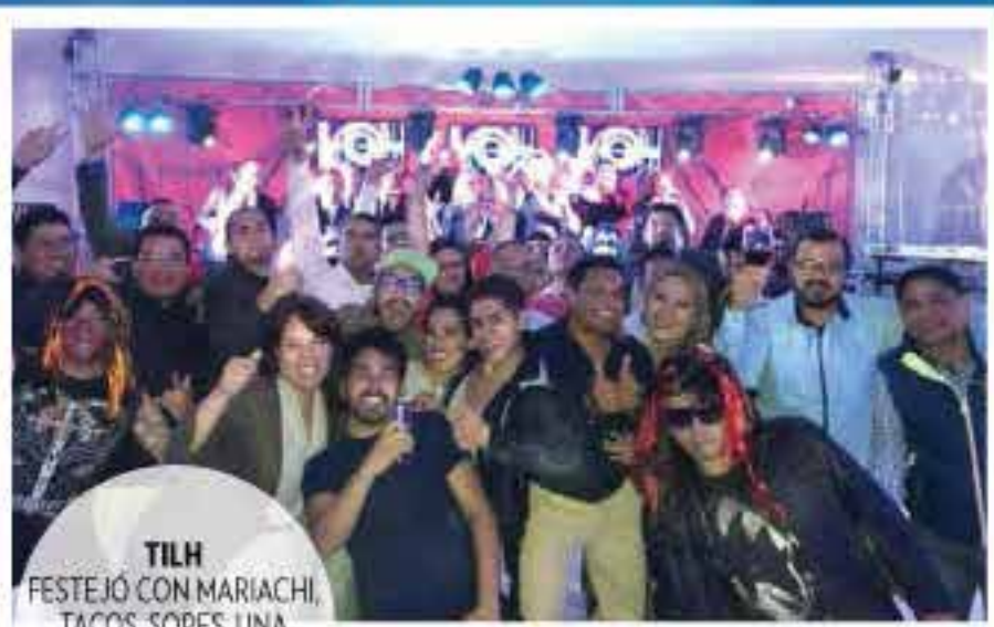
TILH FESTEJÓ CON MARIACHI, TACOS, SOPESES, UNA TEQUILADA Y MUCHO BAILE.

Las celebraciones navideñas estuvieron con todo, y así fue como las filiales de Hutchison Ports en México las festejaron: