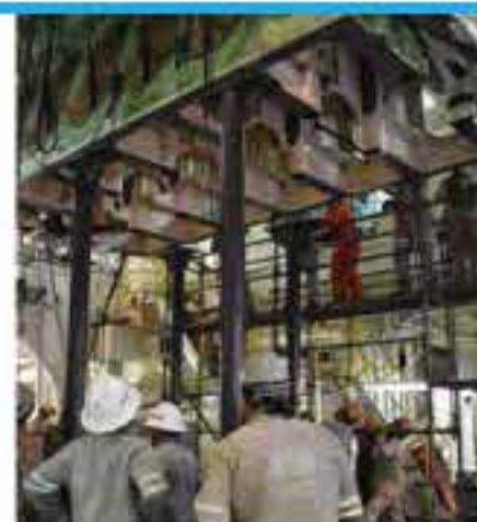
Formas de tiro que elevan el monoblock de 120 toneladas

L uego de 10 días de arduo esfuerzo a bordo del buque Atlántico México, el equipo del astillero logró elevar un monoblock de 120 toneladas de peso, para extraer y deslizar, sobre rieles fabricados exprofeso, el cigüeñal de 42 toneladas de la embarcación que será reemplazado en la segunda etapa del proyecto, alrededor del cuarto mes del 2018. ¡Puro trabajo en equipo! #UNITY!