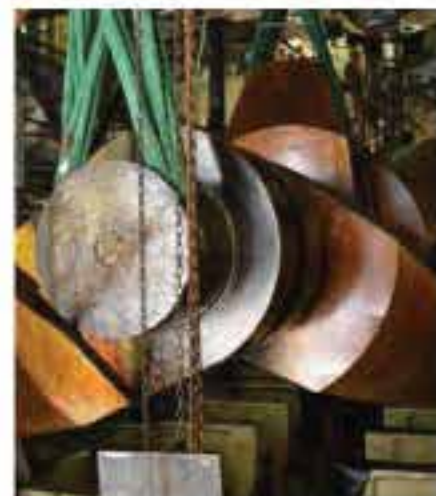
Después se extrae el cigüeñal de 42 toneladas