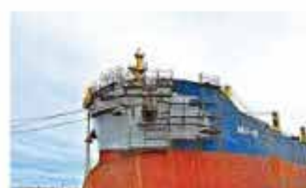
Con la segunda capa de pintura la proa quedó lista