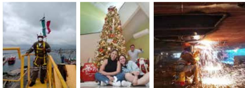
¡Gracias a todos los involucrados por su activa y constante participación!

Para celebrar el 14 de febrero y como parte de la campaña "WeLoveWhatWeDo", en dicha fecha más de 70 colaboradores del astillero participaron compartiendo una foto y una frase mencionando por qué aman trabajar en TNG y qué es lo que más les apasiona de su trabajo. A todos los participantes se les brindó un pase para poder jugar en nuestro tablero de premios, donde podrían ganarse desde Hutchison Points hasta una caja de chocolates o dulces.